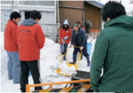
住民の方に除雪方法を教わりながらボランティア活動を行いました。