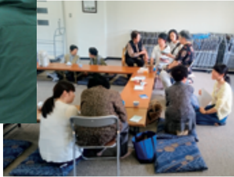
地域のサロンに金城大学の学生が参加し交流を深めています。

そこで、一人暮らしの高齢者宅等に、大学生などの若者や白山ろく以外の地域の方々が除雪ボランティアとして訪問し、住民との交流をはかる事業を行ってきた。 その結果、住民の方々は冬の時期だけでなく、一年を通じて多くの方々に白山ろくに来てほしいと思っていることや普段から抱えている様々な悩みや不安などについても直接その声を聴くことができた。